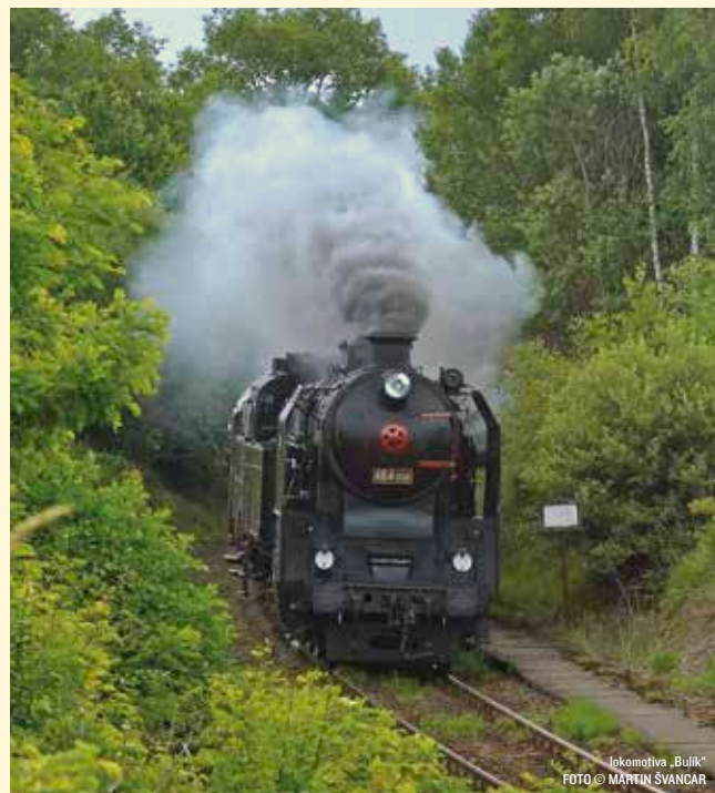
lokomotiva „Bulík“